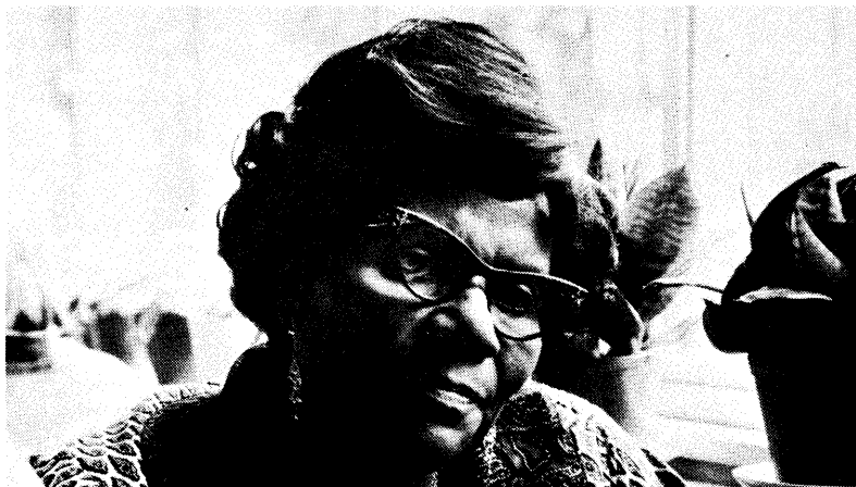
ANNIE JIAGGE, kvinnlig domare från Ghana:

● Hjälp misshandlade kvinnor, hustrur och våldtäktsoffer... Ta reda på av polis, från sjukhus hur utbrett problemet är där ni bor. Tala med politiker, gör allmänheten uppmärksam.