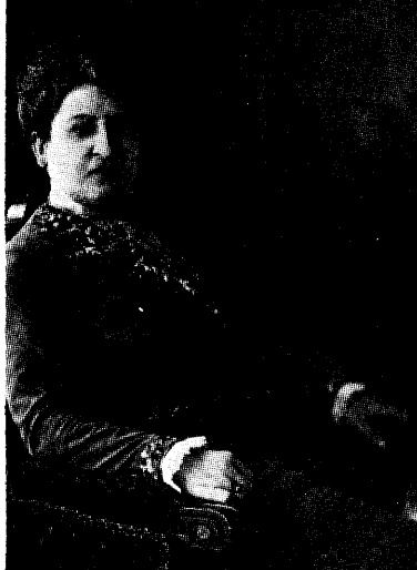
Aletta Henriette Jacobs

Aletta Henriette Jacobs (1854—1929) kom från en emanciperad syskonkrets i Holland. Hon var själv den första kvinna som tog akademisk examen (läkare 1878), hennes syster Charlotte blev Hollands första kvinnliga apotekare och systern Frédérique den första kvinna som tog betyg i högre elementär matematik.