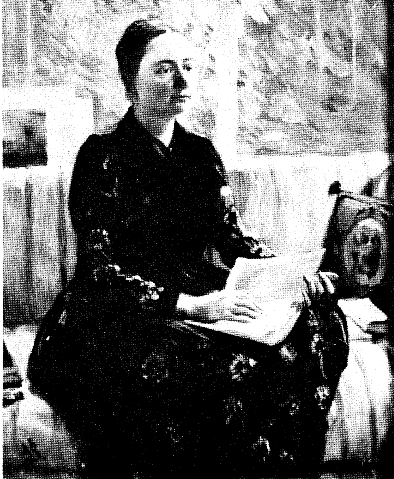
Ellen Key i 40-årsåldern. Porträtt av Richard Bergh målat 1891.

Ellen Keys verk förefaller något svårlästa.