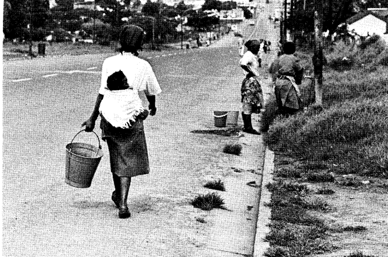
En gata i ett typiskt township-område.

dock aldrig. Till och från fabriken går en ständig ström av skiftarbetare. Från tågen hörs ett evigt tjutande. Föreställ er vid gryningen den afrikanska kvinnan, många med två eller tre barn med sig, varav ett kanske bärs på ryggen, lämna hemmet för arbetet i staden. Mat för dagen bär de ibland på huvudet eller under den fria armen.