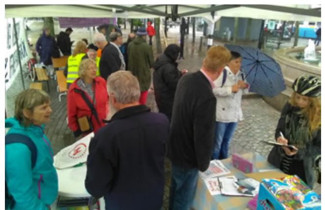
och i regn.