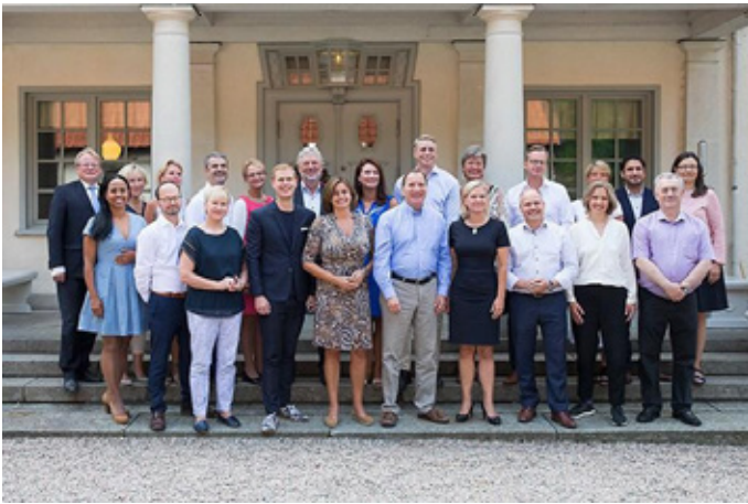
Sveriges första feministiska regering. Bild tagen på Harpsund