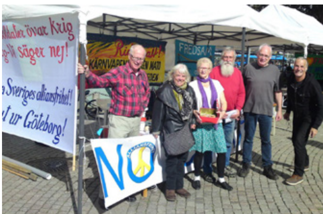
Nej till Aurora i solsken