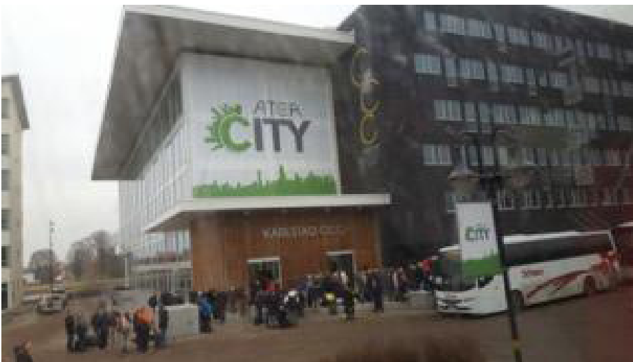
Karlstad Conference Center

Sammanfattningsvis tycker jag att Forum Jämställdhet förmedlar viktig kunskap och information i stor mängd och av hög kvalitet, men likt de flesta andra konferenser ges det väldigt lite tid för de som kommit dit som konferensdeltagare att göra sig hörda. Varför inte minska antalet programpunkter och inbjudna talare, för att ge mer utrymme åt de som verkar på basplanet och som betalat åtskilliga tusenlappar för att komma dit.