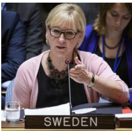
Margot Wallström talar i FN på Internationella dagen för avskaffande av kärnvapen 21 sept

Att Sverige måste tillsätta en utredning i frågan har nog upprört alla i fredsrörelsen. Det är obegripligt med tanke på vad man redan vet om effekterna av att använda kärnvapen. Plus den långa historia som Sverige har när det gäller fred och nedrustning, i synnerhet i frågan om kärnvapenförbud.