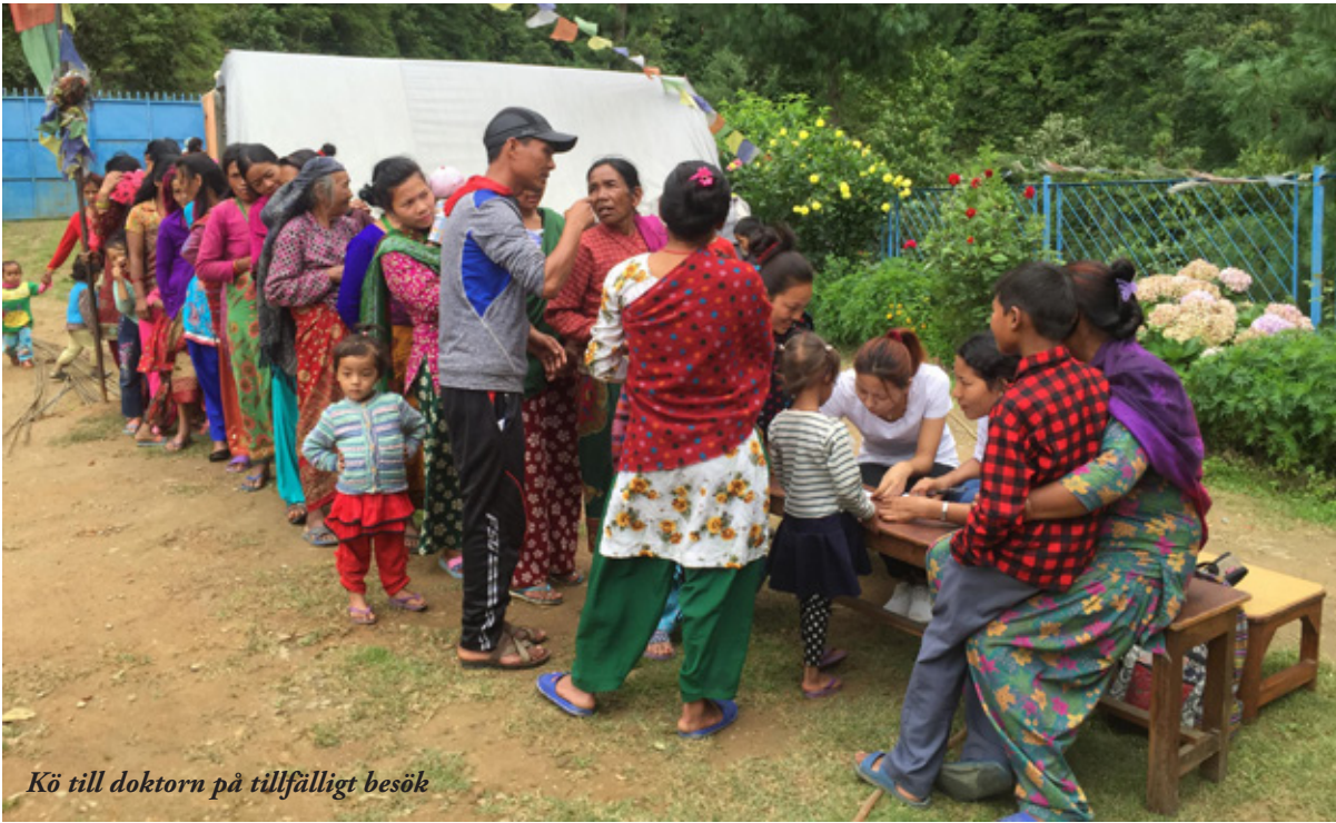
Kö till doktorn på tillfälligt besök

tatis, majs, rotfrukter, bönor m.m. En del har boskap, bufflar, getter och höns. Fatigdomen är stor, men några har lite större areal att odla på än de andra och odlingarna finner man i smala terrasser på de branta sluttningarna. Det som inte behövs för familjen kan säljas till uppköpare i Kathmandu. Förtjänsten blir dålig. Det mesta av den går till mellanhänderna och kilopriset beror på hur stark man är i förhandlingar med uppköparna.