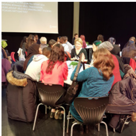
Åsa Regnér med Angered's elever

Fredagen den 12 januari invigde jämställdhetsminister Åsa Regnér landets första myndighet som ska samordna de nationella strategierna för att förebygga mäns våld mot kvinnor, hedersrelaterat våld och prostitution. Uppdraget består i att samla in fakta för att analysera och påskynda de jämställdhetspolitiska målen för att uppnå verklig