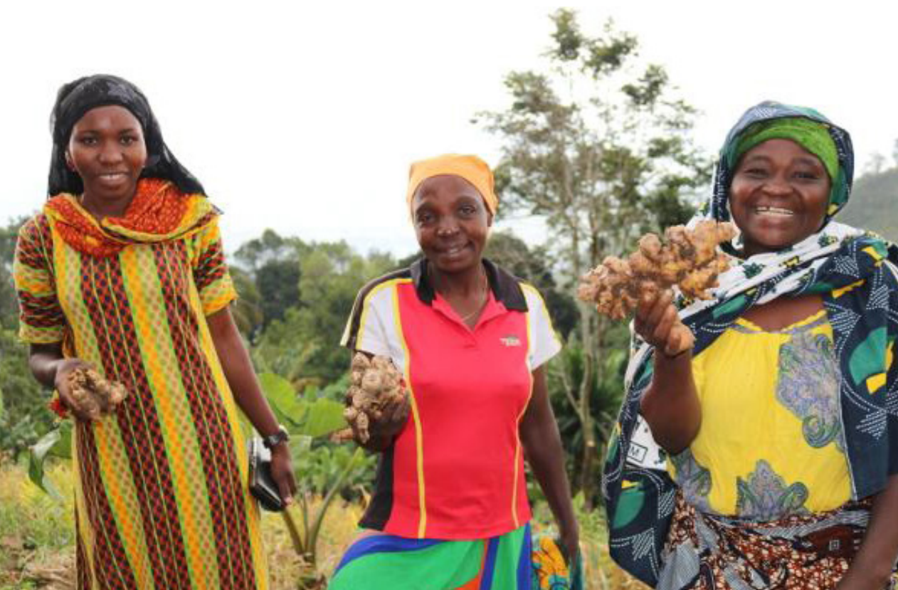
Upendo företaget har specialiserat sig på ingefära.

Barnen kan studera. Lagrad solenergi har ersatt kerosen som belysningskälla.