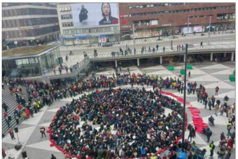
Bilder från manifestationen på Sergels torg 2025