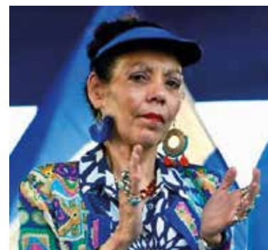
Bilden: Rosario Murillo nybliven president jämte maken Daniel Ortega i ett delat presidentskap.

De personer i Nicaragua, som öppet firade Maduros gripande, fängslades. Till de länder som de senaste åren stött Nicaragua diplomatiskt och/eller ekonomiskt hör Iran, Ryssland,